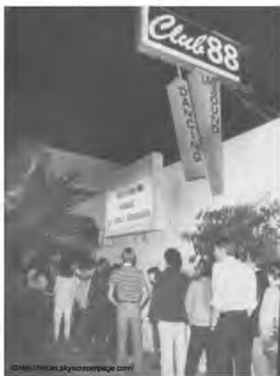
▲ロサンゼルスにもあった CLUB88 (1970年頃)