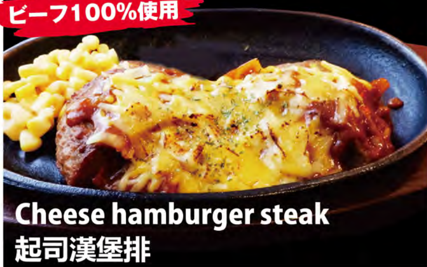
Cheese hamburger steak 起司漢堡排