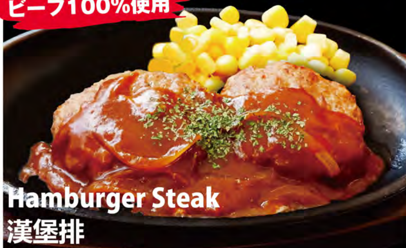
Hamburger Steak 漢堡排