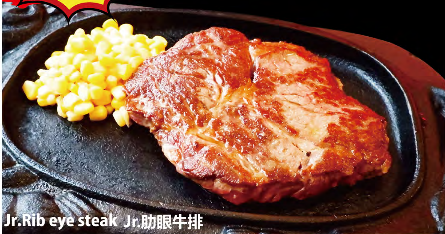
Jr. Rib eye steak Jr.肋眼牛排