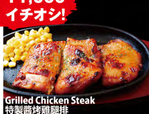
Grilled Chicken Steak 特製醬烤雞腿排