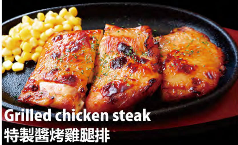
Grilled chicken steak 特製醬烤雞腿排