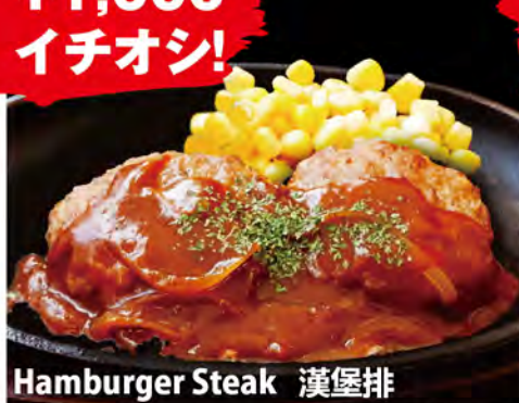
Hamburger Steak 漢堡排