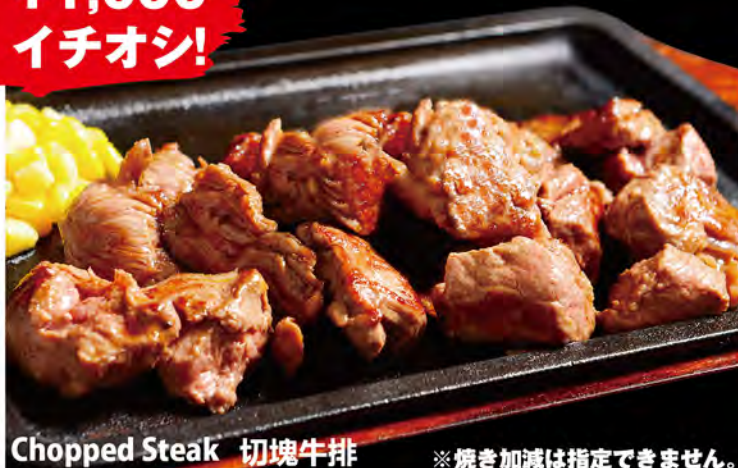
Chopped Steak 切塊牛排