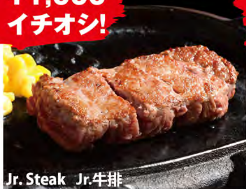
Jr. Steak Jr. 牛排