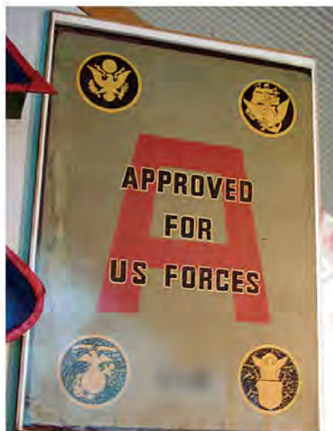
▲現在でも記念としてAサインを掲示している飲食店がある