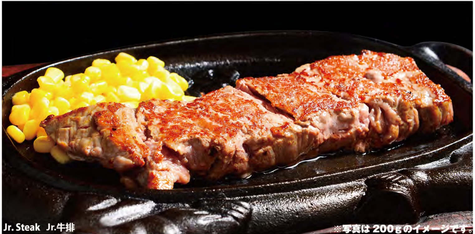
Jr. Steak Jr.牛排