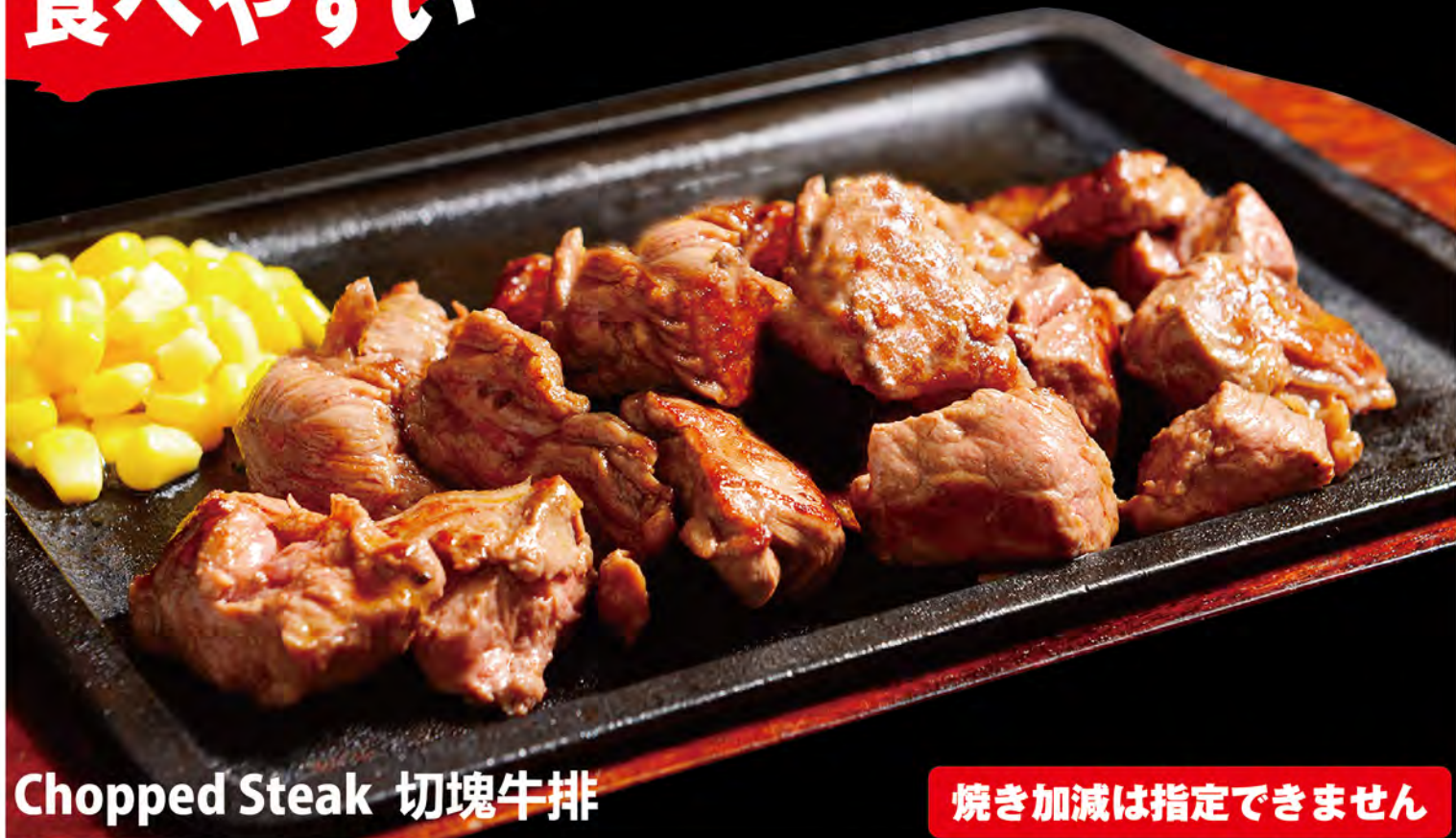
Chopped Steak 切塊牛排