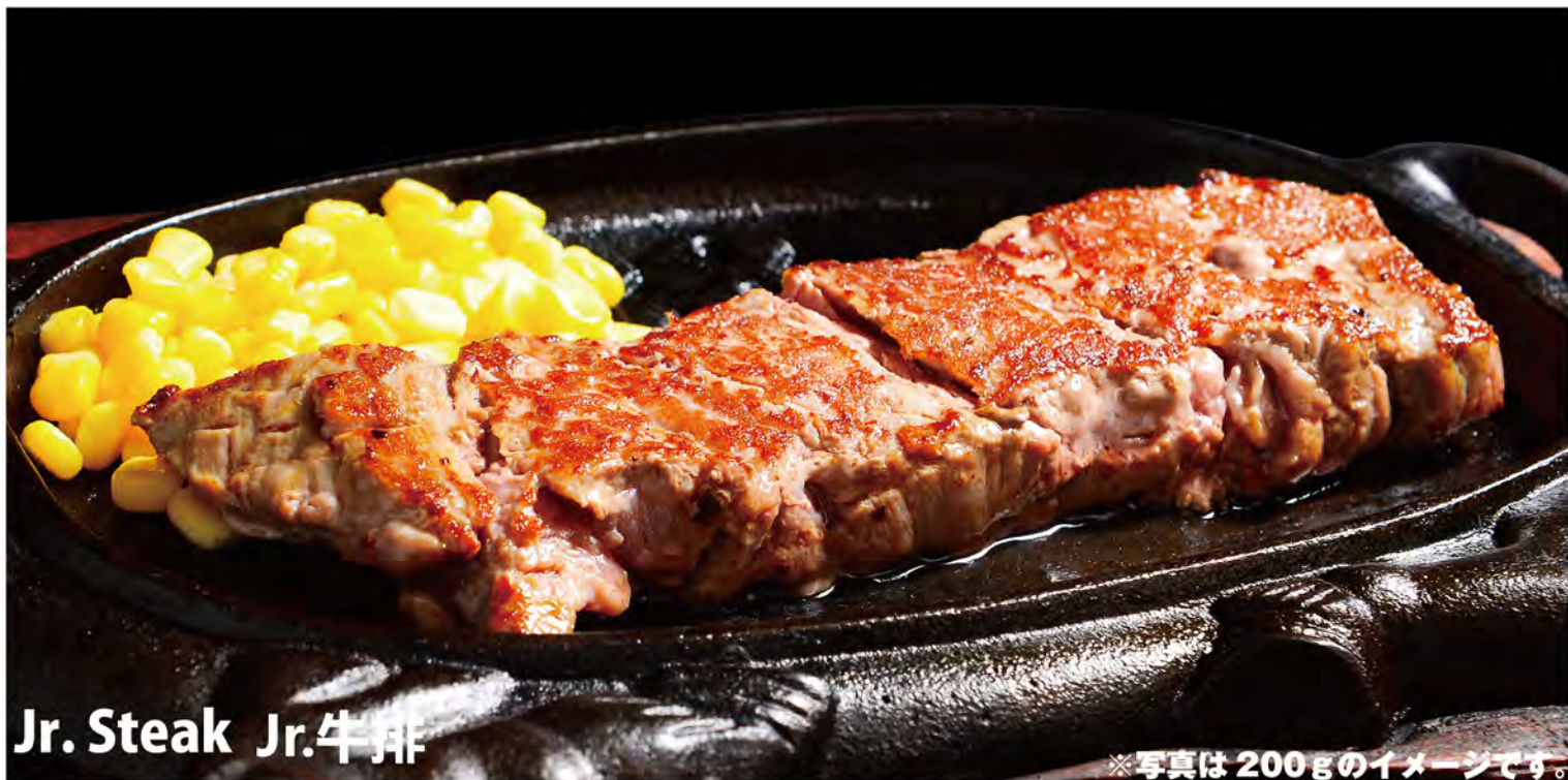
Jr. Steak Jr.牛排