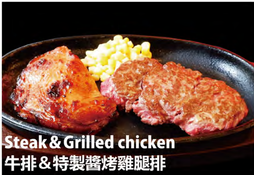
Steak & Grilled chicken 牛排 & 特製醬烤雞腿排