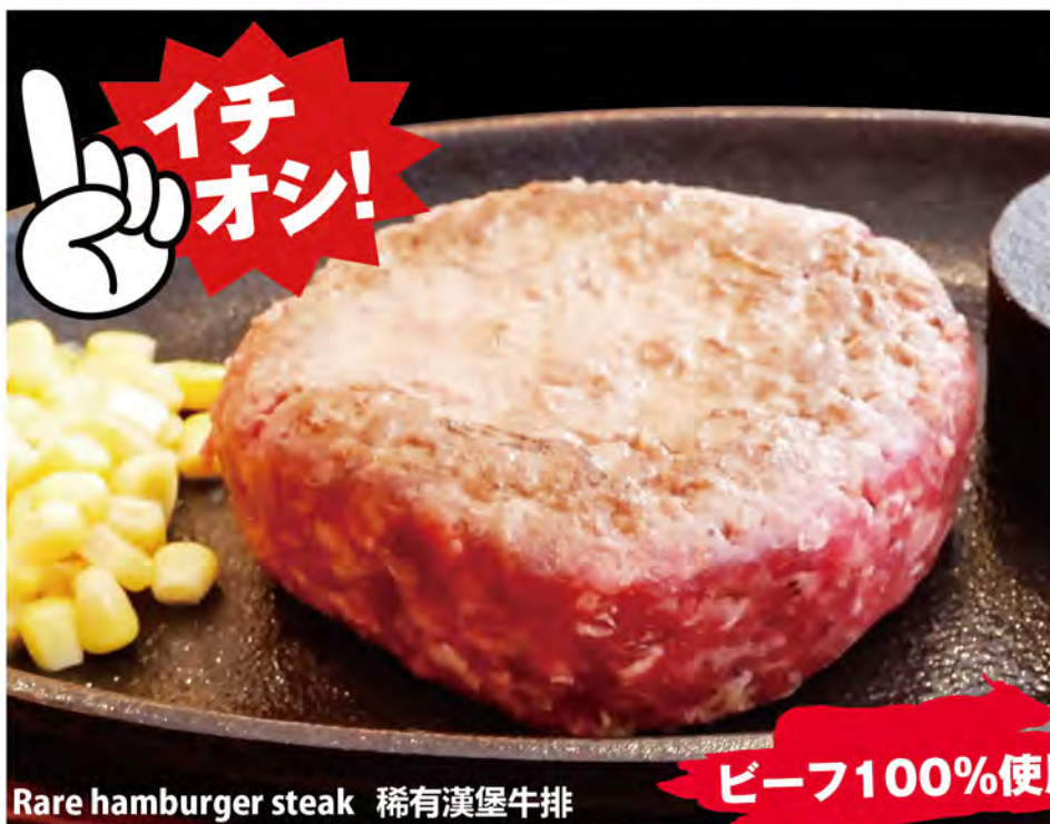
Rare hamburger steak 稀有漢堡牛排