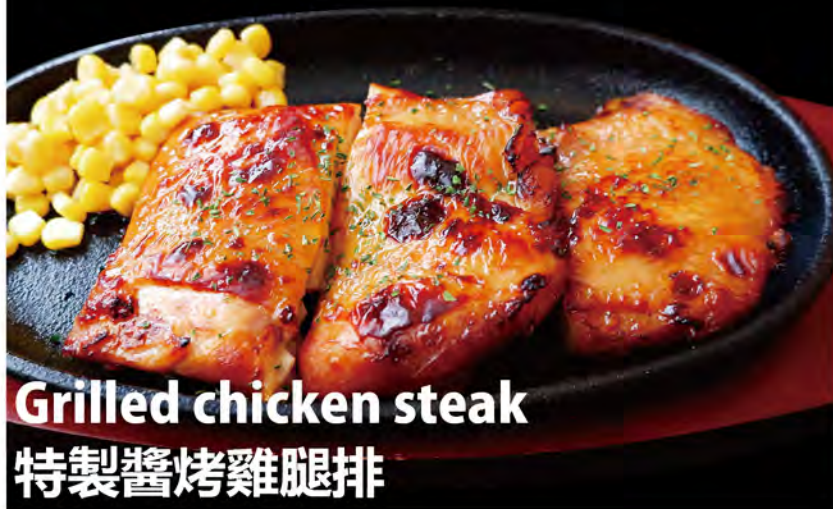
Grilled chicken steak 特製醬烤雞腿排