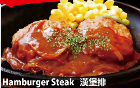
Hamburger Steak 漢堡排