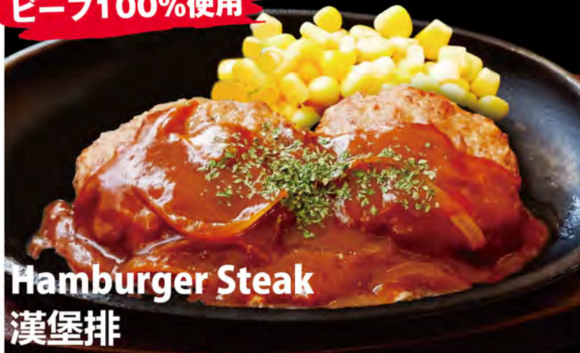
Hamburger Steak 漢堡排