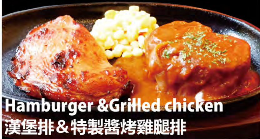
Hamburger & Grilled chicken 漢堡排 & 特製醬烤雞腿排