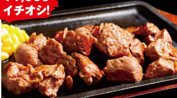
Chopped Steak 切塊牛排 ※焼き加減は指定できません。