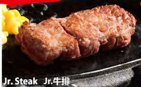
Jr. Steak Jr.牛排