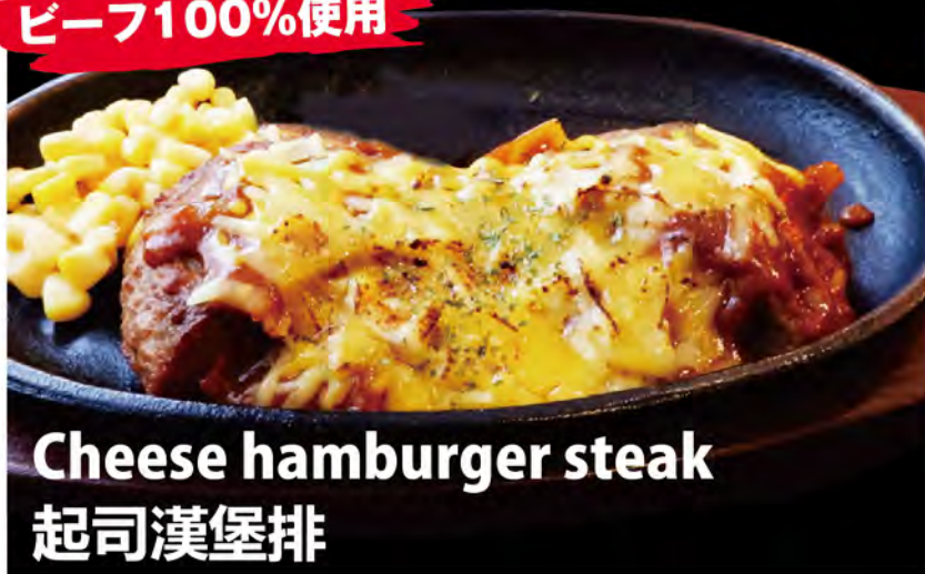
Cheese hamburger steak 起司漢堡排