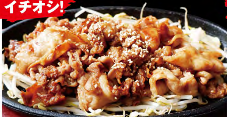
Teppan yakiniku 鉄板焼肉 当店人気メニュー