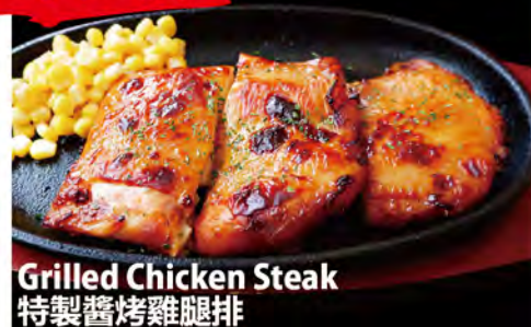
Grilled Chicken Steak 特製醬烤雞腿排