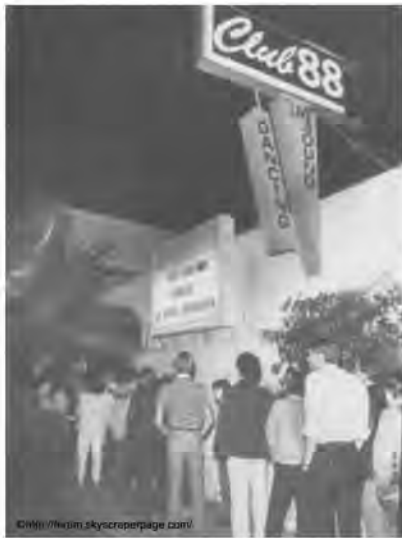
▲ロサンゼルスにもあった CLUB88 (1970年頃)