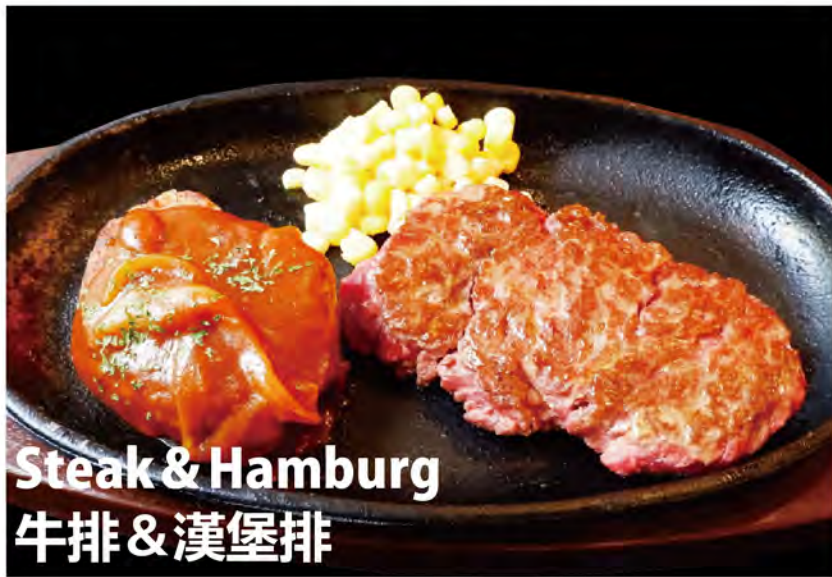
Steak & Hamburg 牛排 & 漢堡排