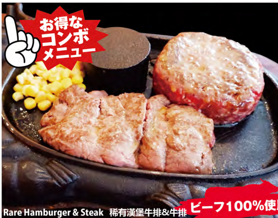
Rare Hamburger & Steak 稀有漢堡牛排&牛排