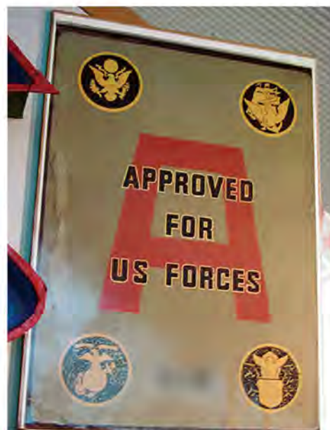
▲現在でも記念としてAサインを掲示している飲食店がある

Aサインとは Aは「APPROVED (公認)」の頭文字。統治下時の米軍が発行した営業許可証であり、衛生面などの厳しい審査に合格した店にのみ発行されたことで、クオリティの高さをも証明するもの