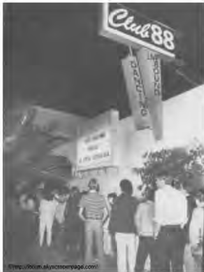
▲ロサンゼルスにもあった CLUB88 (1970年頃)

88という名前の由来 ステーキハウス88のルーツは、1950年代の米軍統治下時までさかのぼる。ニューヨーク州グリニッジヴィレッジに、「CABARET 88 (キャバレーエイティエイト)」という店があった。 日本のデイスコに劇場をミックスさせたようなその店は、連日多くの人々が訪れて列をつくり、当時沖縄に派遣されていた米軍の将校や若い軍人たちの間においても知らない者はいないほどの有名店だったという。そこで1955年、「母国から遠く離れた