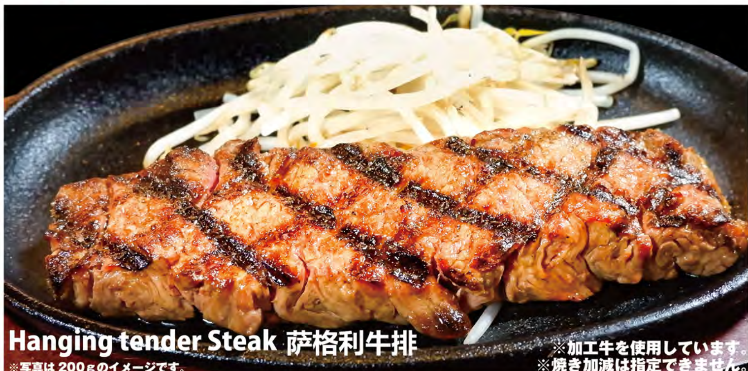
Hanging tender Steak 萨格利牛排