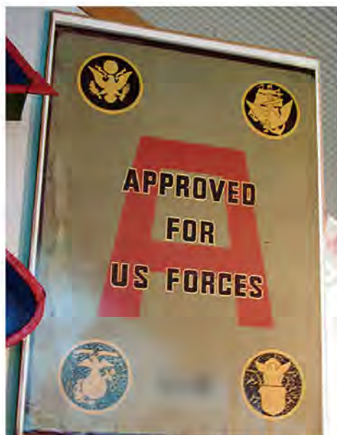
▲現在でも記念としてAサインを掲示している飲食店がある