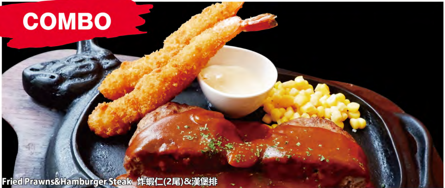
Fried Prawns & Hamburger Steak 炸蝦仁(2尾)&漢堡排