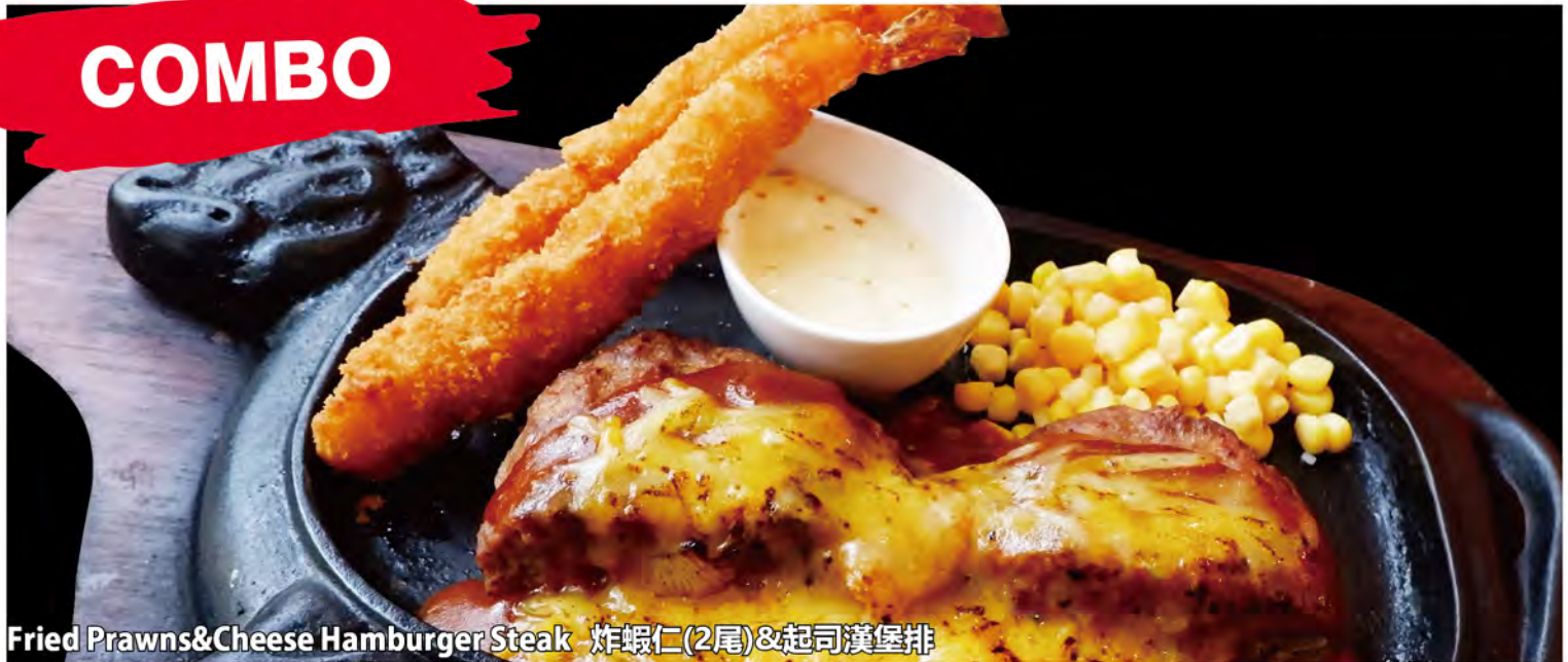
Fried Prawns & Cheese Hamburger Steak 炸蝦仁(2尾)&起司漢堡排