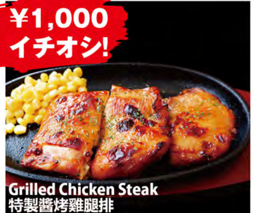
Grilled Chicken Steak 特製醬烤雞腿排