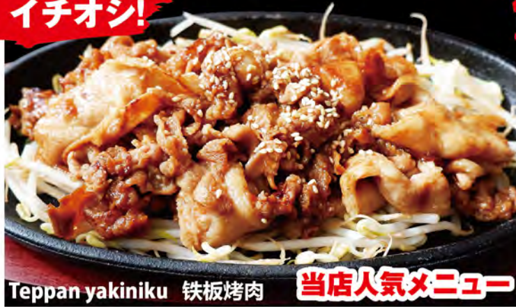
Teppan yakiniku 鉄板焼肉 当店人気メニュー