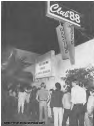
▲ロサンゼルスにもあった CLUB88 (1970年頃)