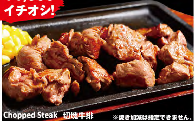
Chopped Steak 切塊牛排 ※焼き加減は指定できません。