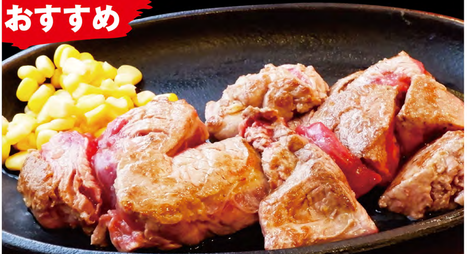
Chopped tenderloin steak 切塊嫩腰牛排