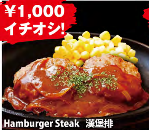
Hamburger Steak 漢堡排