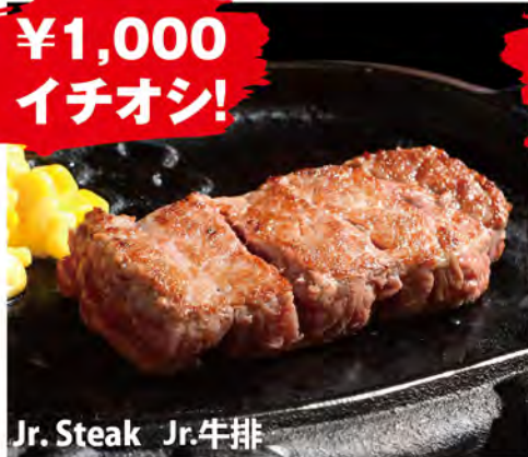
Jr. Steak Jr. 牛排