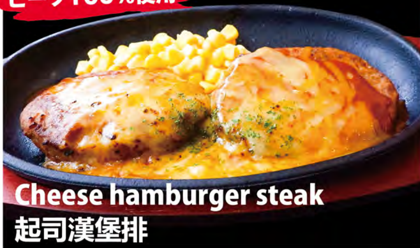
Cheese hamburger steak 起司漢堡排