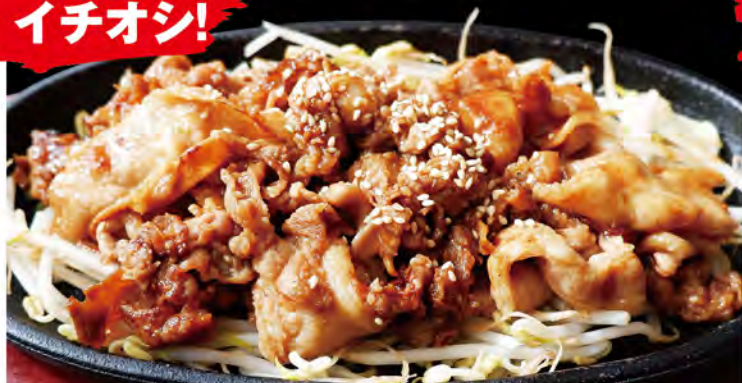
Teppan yakiniku 鉄板焼肉 当店人気メニュー