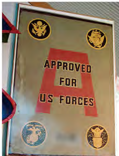
▲現在でも記念として A サインを掲示している飲食店がある

A サインとは A は「APPROVED (公認)」の頭文字。統治下時の米軍が発行した営業許可証であり、衛生面などの厳しい審査に合格した店にのみ発行されたことで、クオリティの高さをも証明するもの