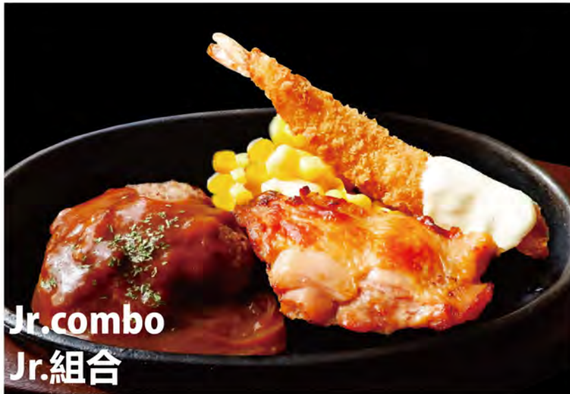
Jr. combo Jr.組合