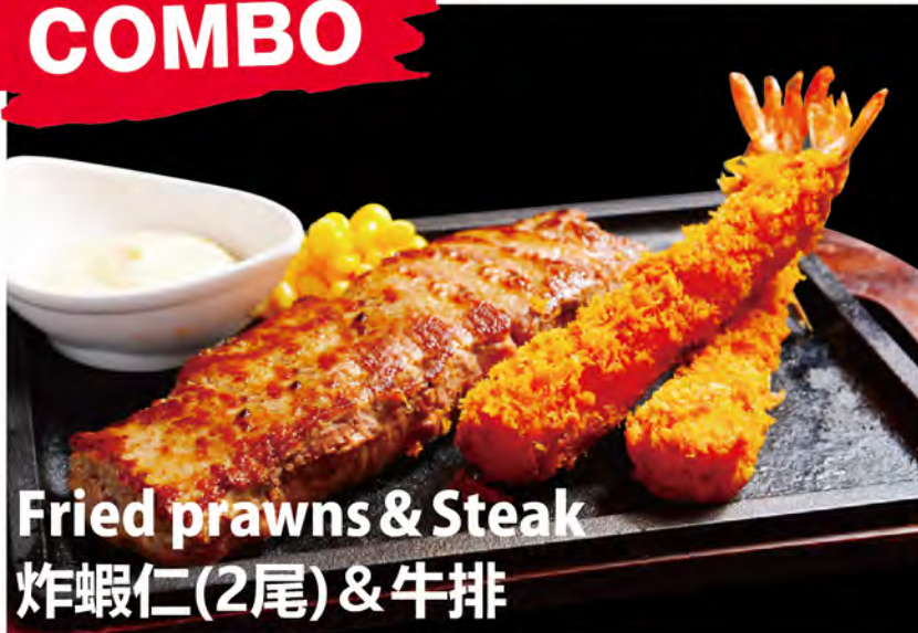
Fried prawns & Steak 炸蝦仁(2尾)&牛排