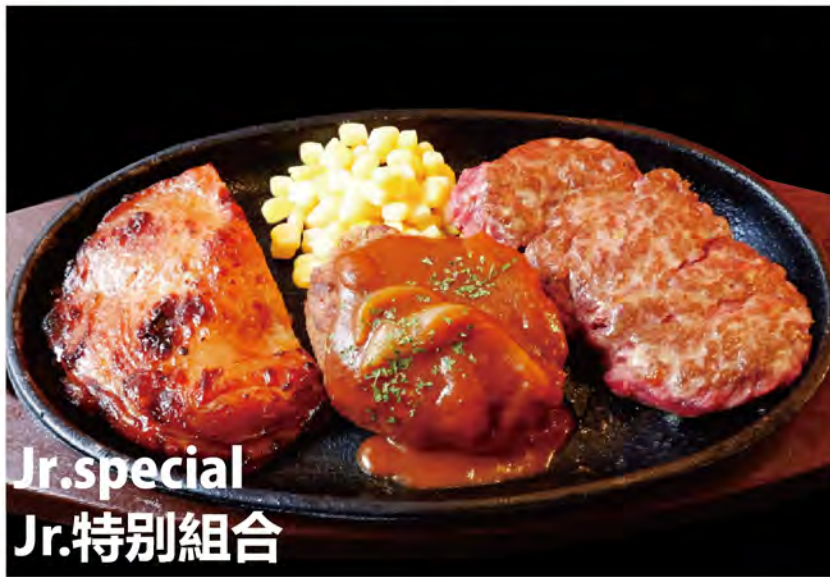
Jr. special Jr.特別組合