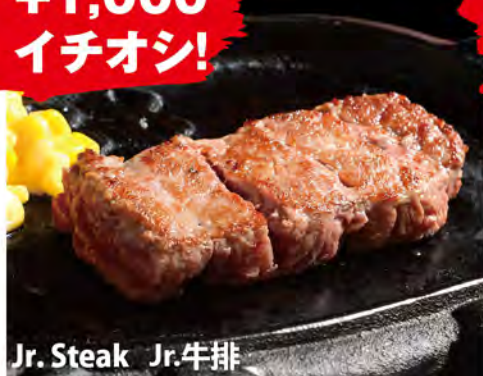
Jr. Steak Jr.牛排