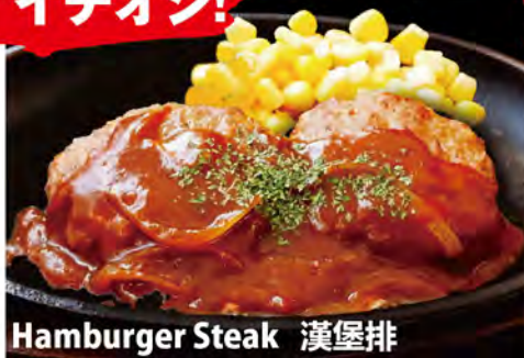
Hamburger Steak 漢堡排