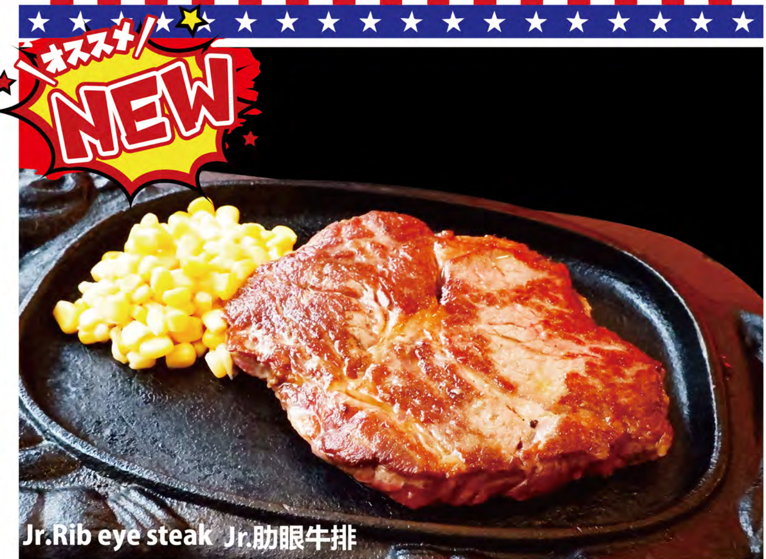
Jr. Rib eye steak Jr. 肋眼牛排