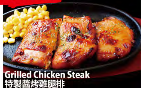
Grilled Chicken Steak 特製醬烤雞腿排